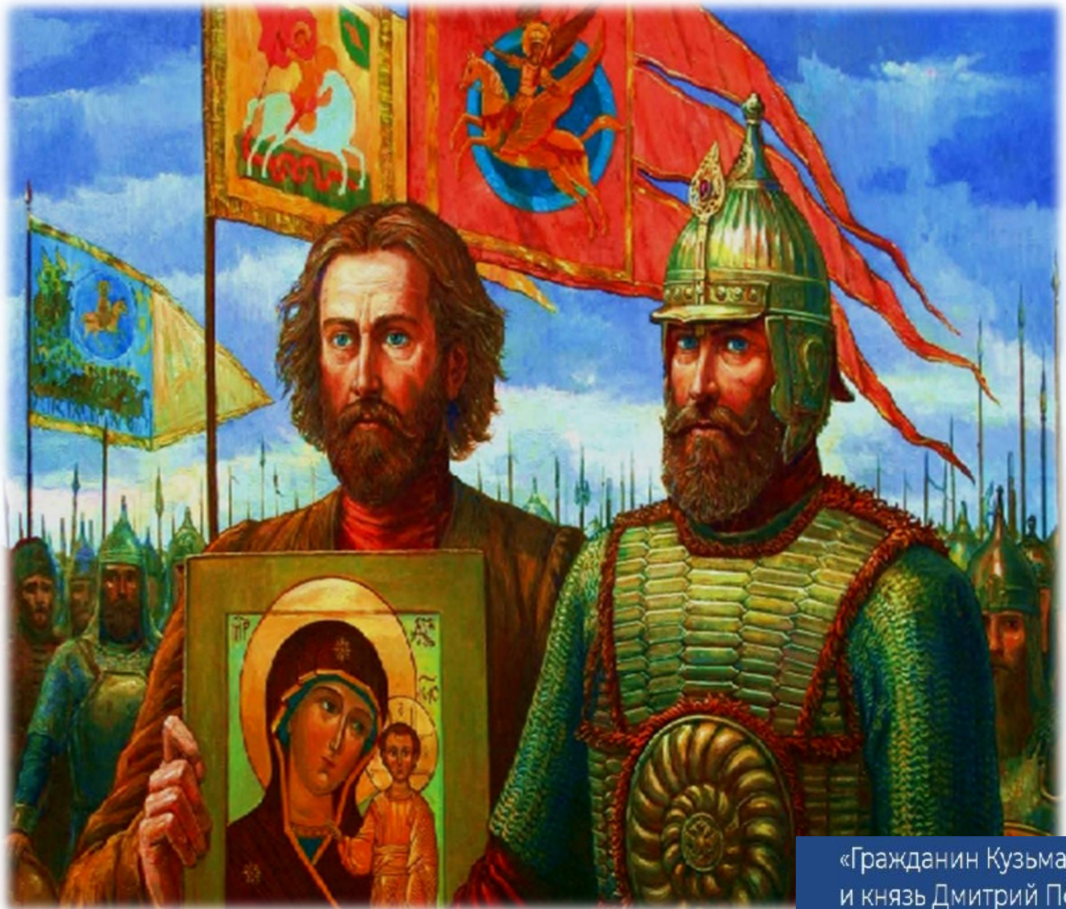
«Гражданин Кузьма Минин и князь Дмитрий Пожарский. 1612 год»